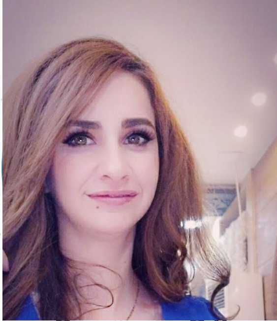
ماجستير ادارة اعمال، جامعة دمشق